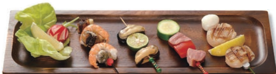
LP-201 プレート(大) 400×130×27(内380×110×8) ¥4,500