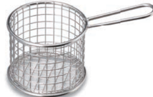
BA-413C フリッターバスケット(丸) 95φ×75 ¥3,600