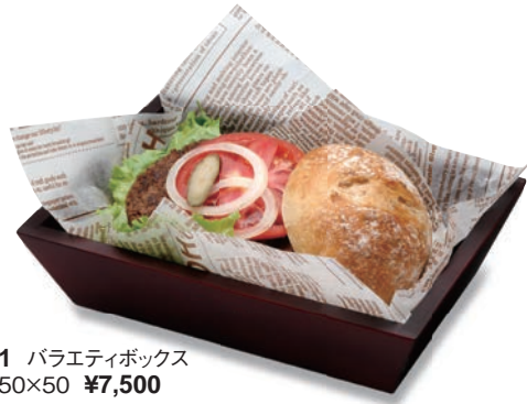
BA-601 バリエティボックス 220×150×50 ¥7,500