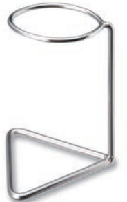
BA-411C フリッタースタンド 95×95×150 ¥2,800