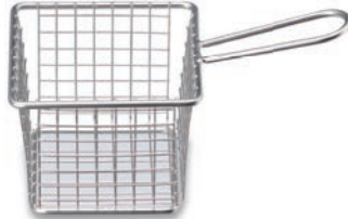
BA-412C フリッターバスケット(角) 100×100×80 ¥3,600