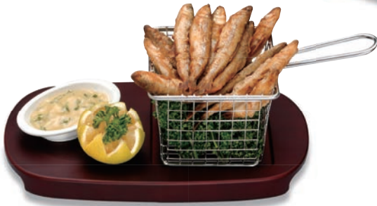
BA-412 フリッターバスケットセット ¥11,050 ●フリッターバスケット(角)(BA-412C) 100×100×80 ¥3,600 ●木台(BA-411F)250×140×20 ¥6,800 ●オーバル小皿(U-10)95×60×20 ¥650