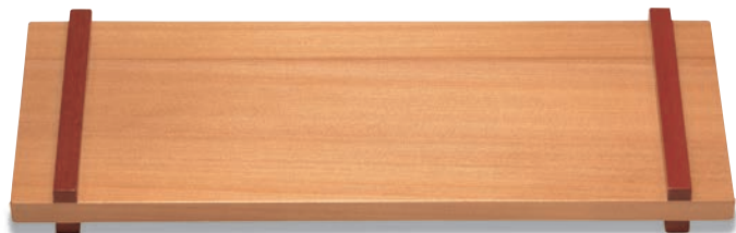
LP-203 プレート(大) 470×190×38(内380×190×10) ¥7,300