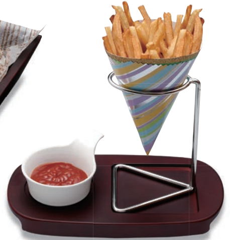
BA-411 フリッタースタンドセット ¥10,560 ●フリッタースタンド(BA-411C)95×95×150 ¥2,800 ●木台(BA-411F)250×140×20 ¥6,800 ●手付小皿(U-11)85φ×110×35 ¥960