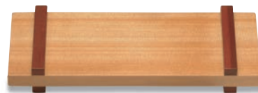
LP-205 プレート(小) 300×120×38(内230×120×10) ¥5,000