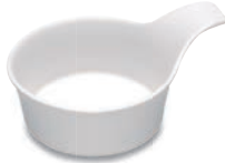
U-11 手付小皿 85φ×110×35 ¥960