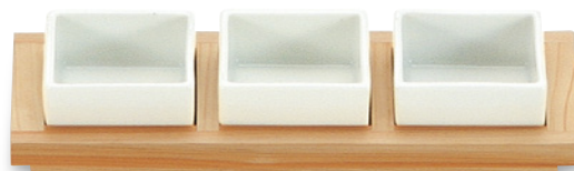
SU-105 小鉢3 245×95×28 ¥4,300 ●陶器(U-3)1個 ¥600