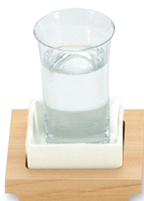
SU-107 酒 95×95×28 ¥1,800 ●陶器(U-3)1個 ¥600