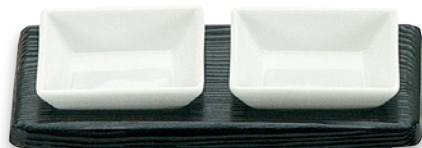
SU-112 黒小皿2 205×110×24 ¥3,000 ●陶器(U-1)1個 ¥600