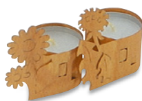
SU-104 小皿2 205×110×28 ¥3,100 ●陶器(U-1)1個 ¥600