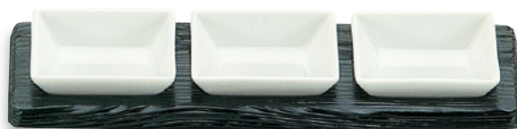
SU-113 黒小皿3 295×110×24 ¥4,000 ●陶器(U-1)1個 ¥600

カジュアルな懐石風料理や ちょっとしたオードブルに。お造り、寿司、 創作料理の盛付けなどにも最適です。