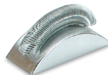
SU-111 黒小鉢3 245×95×24 ¥3,800 ●陶器(U-3)1個 ¥600