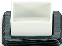
SU-114 酒(黒) 95×95×24 ¥1,700 ●陶器(U-3)1個 ¥600