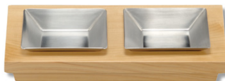
SU-404 小皿2 205×110×28 ¥3,500 ●ステン小皿(S-1)80×80×17 1個 ¥800