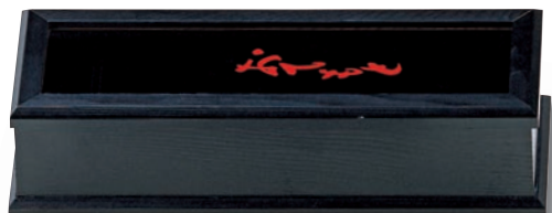
SM-615 箸箱 290×100×72(内225) ¥7,400