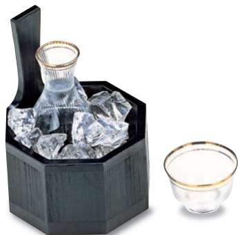
SM-406 冷酒桶 125×125×170 ¥13,000

最新技術により杉の木目を浮き出した画期的な製品です。黒の重厚さとシンプルなデザインが料理を美しく豪華に引き立てます。