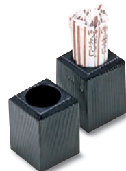
SM-609 角ようじ 43×43×60 ¥1,100