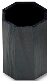
SM-606 箸立 90×90×130 ¥3,200