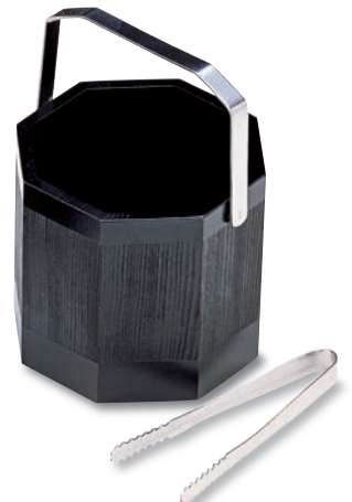
SM-607 アイスバール 135×135×130(1100cc) ¥14,800