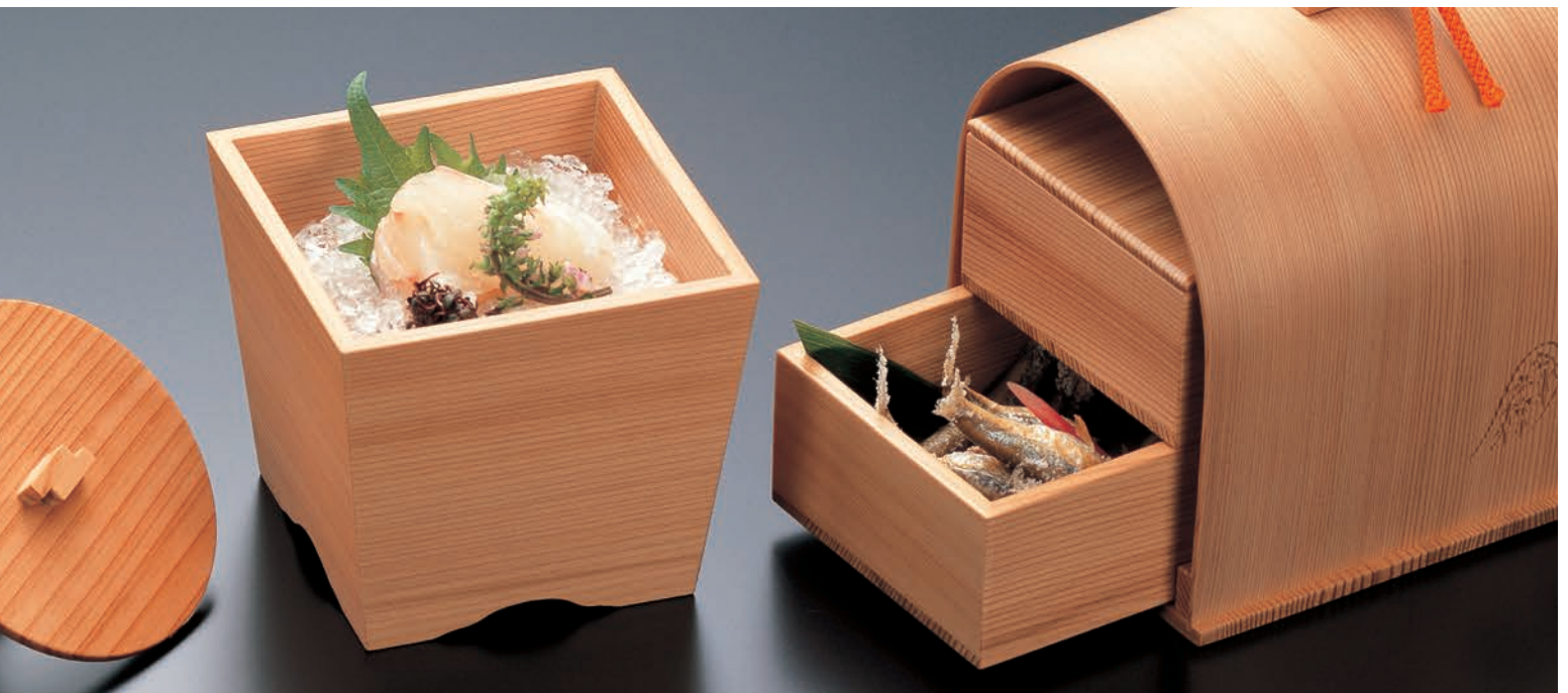
材質:すぎ ウレタン塗装