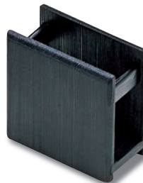
SM-611 ナフキン 110×55×110 ¥2,900