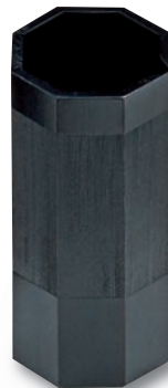
SM-608 水差し 90×90×200(800cc) ¥11,500