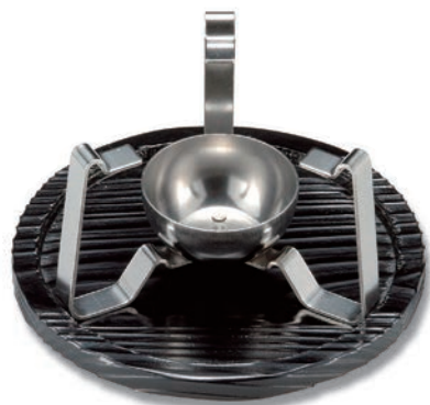
BS-201C クイックコンロ 135φ×80 ¥2,400 BS-201F 木台 180φ×13(153φ×5) ¥2,000