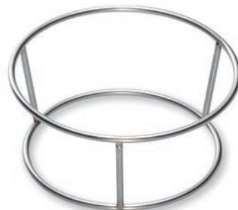
BS-202C リングスタンド 130φ×58(115φ) ¥800 ※在庫品限り