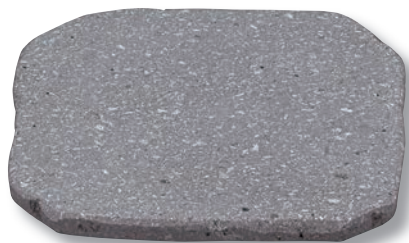
HA-402S 自然風石焼プレート 約150×150×12 ¥5,400