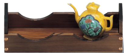
N-614 長角カスター 280×90×85 ¥2,500