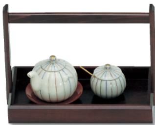
N-617 手付カスター 230×120×170 ¥4,300