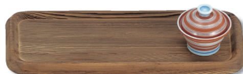
N-212 長角皿(大) 300×120×20 ¥2,700