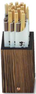
N-613 箸立 80×80×130 ¥2,900