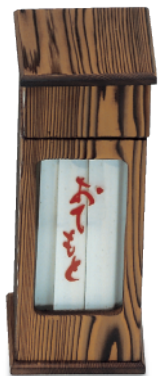
N-616 箸立箱 100×100×260 ¥7,200