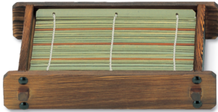
N-305 長井ゲタざる 235×160×50 ¥3,200