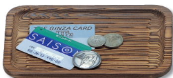
N-701 会計盆(大) 220×150×20 ¥2,600