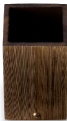
N-618 箸立(大) 90×90×140 ¥3,000