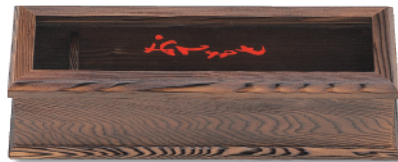
N-615 箸箱 290×100×72(内230) ¥6,800 ※受注生産品