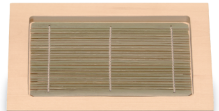
NB-206 そば皿(小) 230×180×20(内183×132×10) ¥9,000