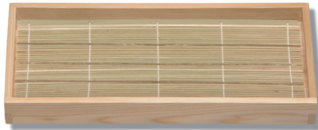
NB-201 板そば 395×190×40(内375×170×25) ¥9,700

単品のそばメニューはもちろん、竹すだれを取り、盛皿、盛台、お料理箱としても活用できます。