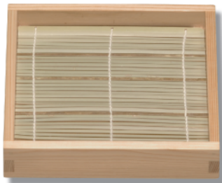
NB-203 正角そば 195×195×40 (内175×175×30) ¥5,100