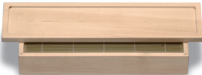
NB-204 箱そばセット 380×135×65 ¥18,000 ●本体(NB-204M) 320×135×55(内300×115×30) ¥10,300 ●盛皿(NB-204F) 380×100×20(内360×80×3) ¥6,300 ●竹す(NB-204T) 298×113 ¥1,400