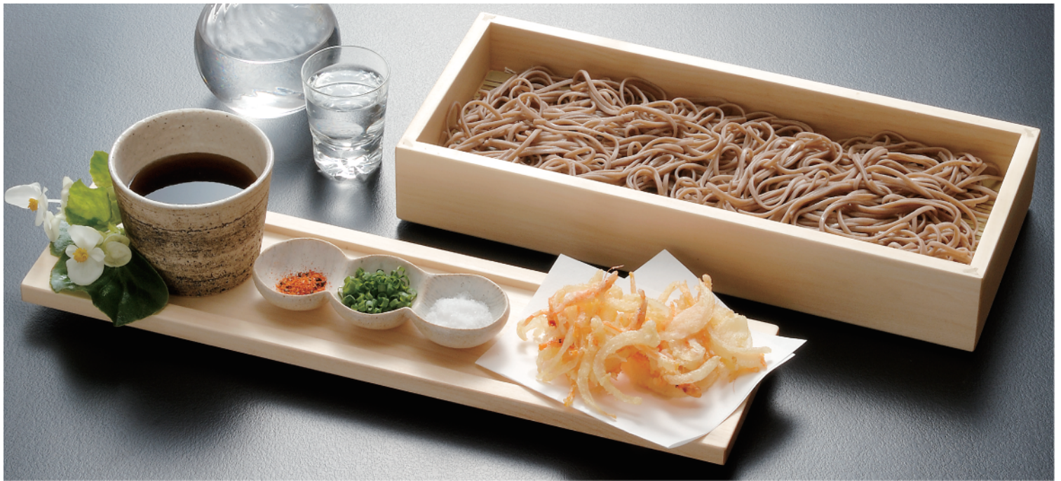
材質:ひのき しな ウレタン塗装