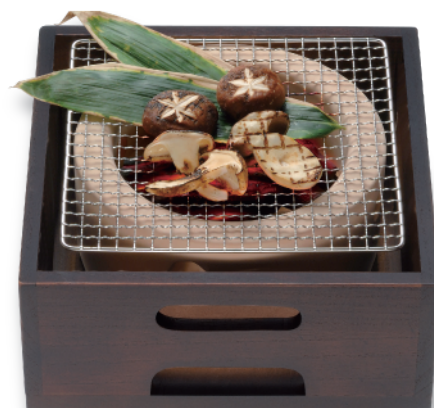
CN-603 火鉢セット(丸) 270×270×130 ¥35,000 ●コンロ (CN-603C) 210φ×100 (内160φ×50) ¥17,000 ●木箱 (CN-601F) 内240×240×100 (耐火ボード付) ¥18,000