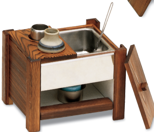
CN-415 固形湯豆腐セット(ねずこ) 215×170×170 ¥26,200 ※在庫品限り