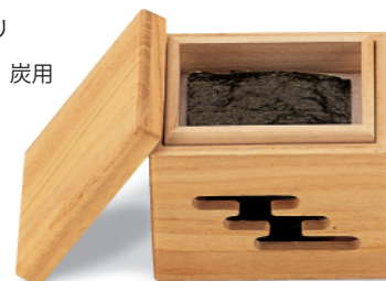
CW-421 のり焼セット 123×93×103 ¥6,550 ※中合はケイカル板に仕様変更