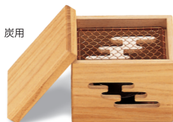
CW-422 あみ焼セット 123×93×103 ¥12,550 ※中合はケイカル板に仕様変更