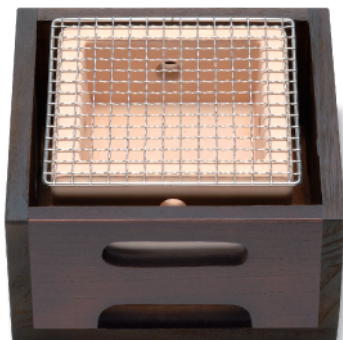
CN-602 火鉢セット(小) 220×220×130 ¥29,000 ●コンロ (CN-602C) 160×160×100(内120×120×50) ¥13,000 ●木箱 (CN-602F) 内190×190×100(耐火ボード付) ¥16,000