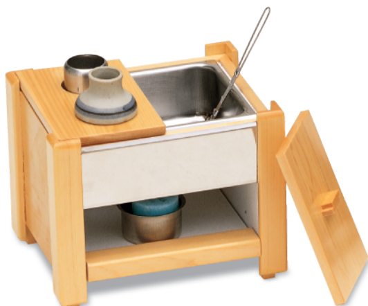
CW-413 固形湯豆腐セット(白木) 215×170×170 ¥26,200 ※在庫品限り