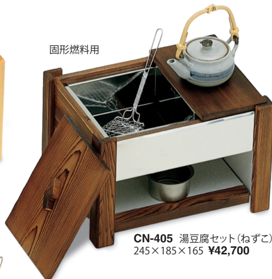
CN-405 湯豆腐セット(ねずこ) 245×185×165 ¥42,700