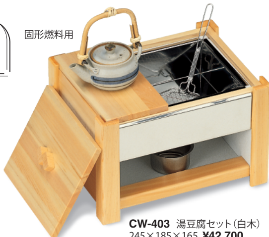
CW-403 湯豆腐セット(白木) 245×185×165 ¥42,700